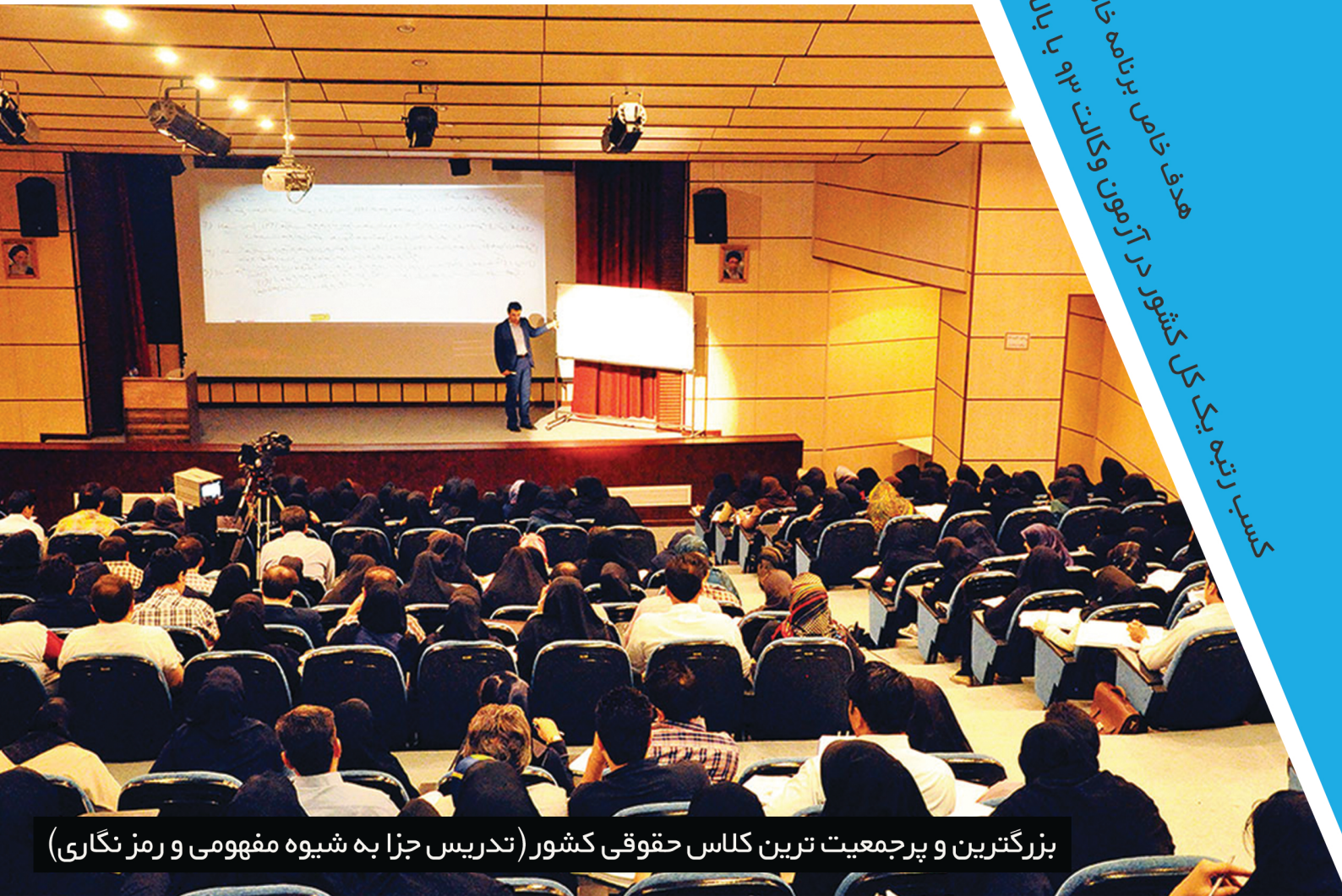
بزرگترین و پرجمعیت ترین کلاس حقوقی کشور (تدریس جزا به شیوه مفهومی و رمز نگاری)